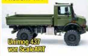
Unimog 437 von ScaleART