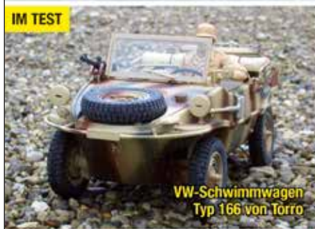
VW-Schwimmwagen Typ 166 von Torro