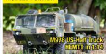
M978 US-Half Truck HEMTT in 1:14